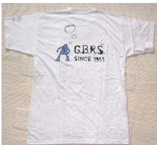
T-shirt : 10 € pièce

✂ Des T-shirts et des polos sont toujours en vente