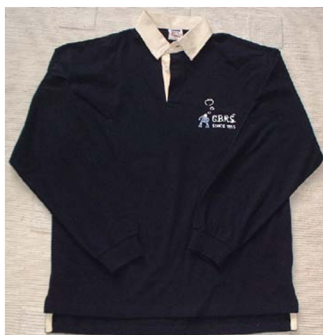
Polo : 25 € pièce

✂ Des bières GBRS au logo des 50 ans sont également toujours en vente :