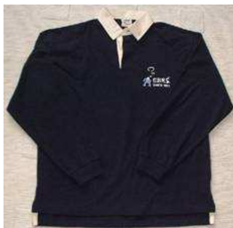
Polo : 25 € pièce

✂ Des bières GBRS au logo des 50 ans sont également toujours en vente :