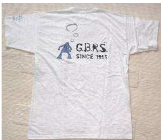
T-shirt : 10 € pièce

✂ Des T-shirts et des polos sont toujours en vente